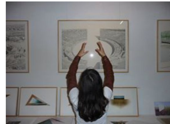
Mado, Performance au vernissage Elena Mooren et Henri Fornasari, 2010, Photo © Elena Mooren

Prochainement L'Exposition de Poche 3e édition du 12 au 16 mai à Bordeaux Présentation du tableau "Investigation du pur désir"