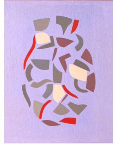
Etude de femme bleue, Sébastien Nadin

나딘은 처음에 유명한 푸르니에 갤러리를 포함한 센 거리의 갤러리에 전시했다. 그리고 갤러리 프레데릭 페인트와 스튜디오 드 이미지에서 나딘은 화가이자 친구인 장 노엘 셀브와 함께 그룹 전시회에 참가했다. 그는 또한 박람회 (Art3F...)와 현대 미술을 위한 카르티에 재단(Cartier Foundation for Contemporary Art)에서 자신의 작품을 전시했다 그러나 세바스티안 나딘은 일찍이 독립과 평온에 대한 취향을 보였고, 따라서 공식적인 서킷의 여백에서 경력을 발전시키겠다는 의지를 보였다. 예를 들어, 그는 주로 일 드 프랑스와 부르고뉴의 개인 수집가를 위해 의뢰하여 그림을 그렸다. 하지만, 장학금과역사로서의미하는판테온소르본대학의중심부에있는전시제안으로, 그는 1년동안 크고지칠줄모르는형식의그림을그리는도전을받아들였다. 박람회, NADIN, PEINDRE AU TEMPS DU NUMERIQUE , 2020년 2월 파리 6e의 Souvlot 갤러리에서 개관했다.