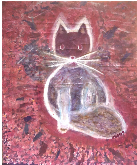
Mado, « Peinture en bâtiment convertie en chat rose », 2020, acrylique, 60 x 73 cm

그래서 나딘 워크숍에서 마도는 그림을 그리려는 욕구를 키운다. 그녀는 2020-2021 코비드 격리에 참가하기 위해 보르도에서 출발은 보르도이다. 그녀는 4개의 작품을 그렸다: "Peinture en bâtiments convertie en chat rose", 아크릴, 2020, 60 x 73 cm / « Songe sur soi-même et regard aujourd'hui », 나무 위의 아크릴, 2020, 거리 예술 / De la permanence dans l'impermanence, 캔버스의 아크릴, 2020, 60 x 73 cm 그리고 "Lapins, chats et Lune" 프레스코화, 나무 위의 아크릴, 2020년.