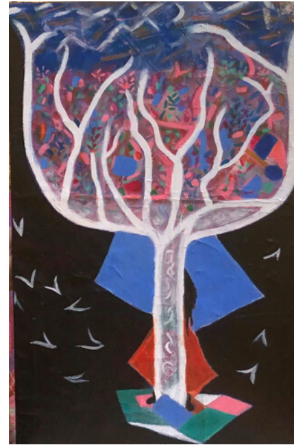
Mado, « Introspection et/ou du pur désir »

그들은 계속해서 협업을 계속하고 « L'Enfance n°1 et n°2 », « Comme Lapin et chat » 세 개의 그림을 함께 만듭니다. « Gamme enfant » 컬렉션의 일부입니다. 예술, 아름다움, 느낌에 대한 자발성과 공통의 열정으로, 두 예술가들은 그들의 듀엣을 추구한다. 놀랄 것도 없이, 춤은 종종 그림에 그려진다; 두 예술 매체 사이에는 진정한 공생과 알찬 협력이 있다.