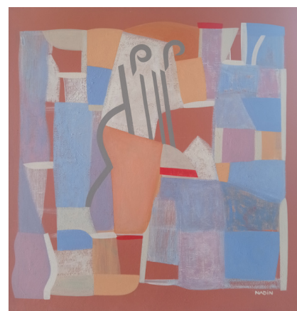
Sébastien Nadin, "D'après Braque"

Retrouvez toutes nos manifestations pluridisciplinaires, L'Expositions D'ART , L'exposition de poche , L'Exposition-Vitrine sur le site de La Nacelle Art Vivant: www.lanacelleartvivant.com