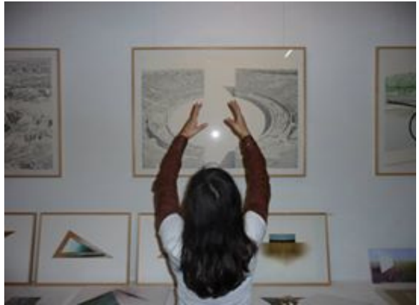
Mado, Performance au vernissage Elena Mooren et Henri Fornasari, 2010

그의 마지막 두 작품인 "Investigation du pur désir"는 캔버스에 아크릴, 2022년, 나무 위에 있는 « Lapins fantastiques »와 아크릴, 2021년 2월 15일부터 22일까지 Limoges의 Pavillon du Verdurier에서 열린 예술 전시회에서 전시되었다.