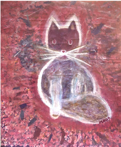
Mado, « Peinture en bâtiment convertie en chat rose », 2020, acrylique, 60 x 73 cm

그래서 나딘 워크숍에서 마도는 그림을 그리려는 욕구를 키운다. 그녀는 2020-2021 코비드 격리에 참가하기 위해 보르도에서 출발은 보르도이다. 그녀는 4개의 작품을 그렸다: "Peinture en bâtiments convertie en chat rose", 아크릴, 2020, 60 x 73 cm / « Songe sur soi-même et regard aujourd'hui », 나무 위의 아크릴, 2020, 거리 예술 / De la permanence dans l'impermanence, 캔버스의 아크릴, 2020, 60 x 73 cm 그리고 "Lapins, chats et Lune" 프레스코화, 나무 위의 아크릴, 2020년.