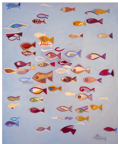
Sébastien Nadin, "Poissons raz de marée en bleu", 2009, acrylique sur toile, 100 x 81 cm