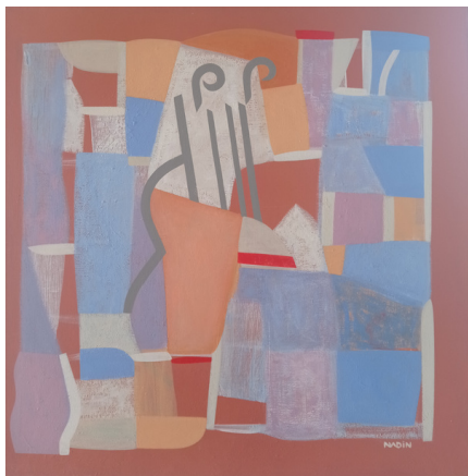
Sébastien Nadin, "D'après Braque"